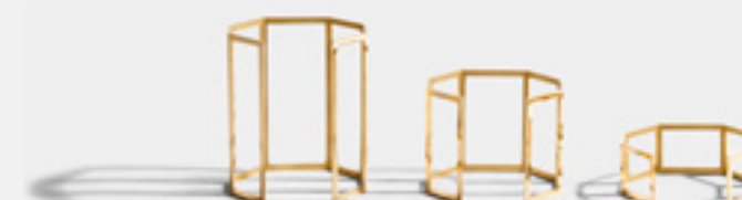
Manchettes de la collection Octogone

Nous sommes actuellement en phase de levée de fonds pour prendre de l'essor, et ouvrir une première boutique en propre.